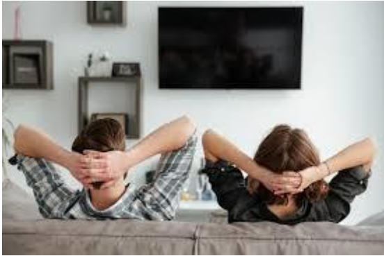
Abbildung 1:

Bitte nimm' dir 5 Minuten Zeit und schau dir diese Datei an.